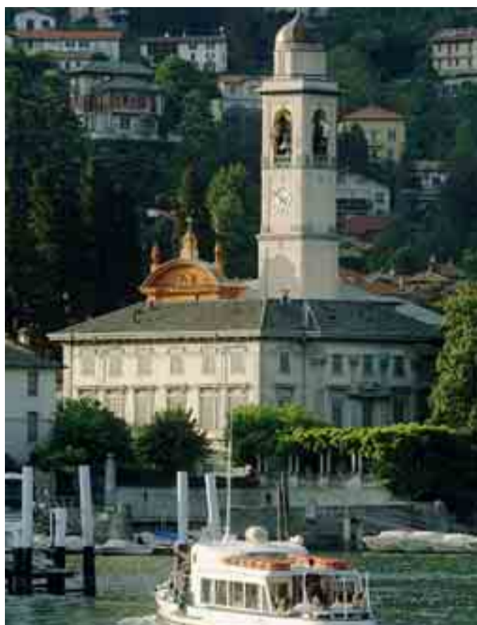
Villa Allamel, una delle perle del lago: potrebbe essere venduta